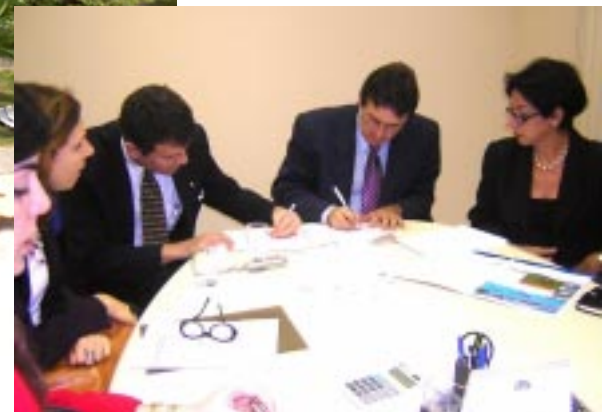
A diretoria da AMEPE e representantes do Blue Tree Park assinaram o contrato de reserva

E stá firmado o contrato que vai garantir a realização do II Congresso Estadual da Magistratura Pernambucana. Escolhido por ser o hotel de Pernambuco com o maior número de apartamentos, o Blue Tree Park, no Cabo de Santo Agostinho, vai assegurar à magistratura pernambucana o mesmo sucesso do I Congresso. (página 7)