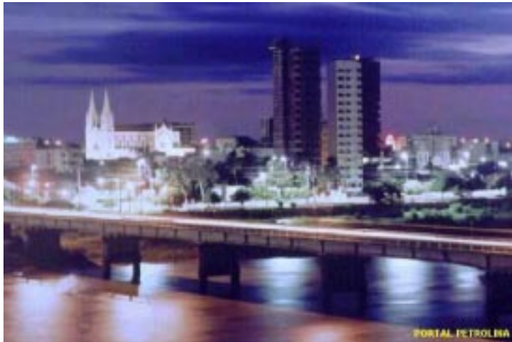
A bela Petrolina será sede do II Encontro Regional

Jueces de Argentina e pela Asociación Civil Justicia Democrática. AMB, AMATRA do Rio Grande do Sul, Associação dos Magistrados da Justiça Militar Federal e Associação dos Magistrados das Justiças Militares Estaduais apoiam o evento.