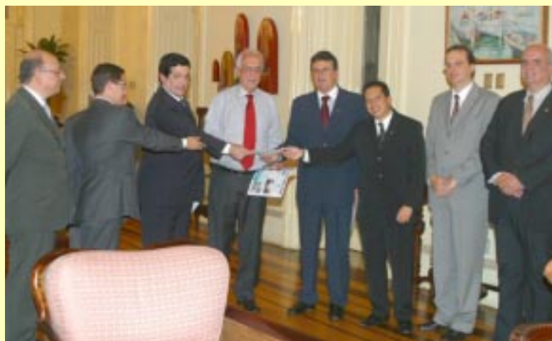
O governador Jarbas Vasconcelos se prontificou a atender à Carta de Afogados da Ingazeira no que for possível ao Executivo.