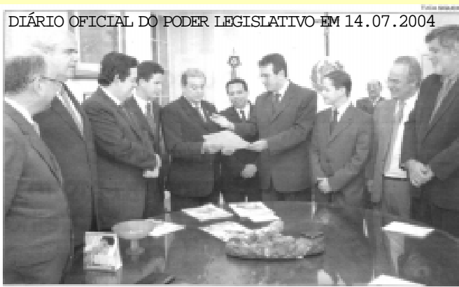
Deputados receberam documento que enumera os maiores problemas de Justiça no Estado de Pernambuco

O BALANÇO DE SEIS MESES DA NOVA DIRETORIA. A BOA PRÁTICA DE PRESTAR CONTAS AOS ASSOCIADOS. (PÁGINA 3)